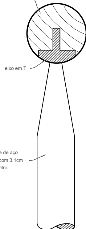
DETALHE DO CORRIMÃO

corrimão em mogno com um diâmetro de 5cm